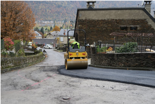
(Rue du Caillouris)

La Communauté de Communes du Pays de Luchon détient la compétence en matière de voirie. C'est au titre du pool routier, que certaines voies communales ont été refaites :