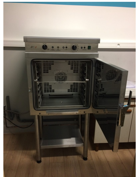
Le four de réchauffage.

L'évier, trop petit, a été remplacé par un bac inox, avec douchette, plus adapté au lavage des nouveaux plats.