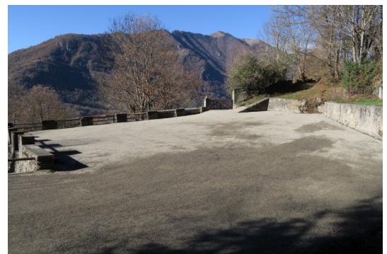
(Le parking de l'ancienne baignoire à moutons)

Le chemin d'accès aux habitations CROUZET, ESNAULT, BERTIN a été également réhabilité et la partie qui présentait des faiblesses a été renforcée.