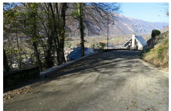
(Cours de la Castagnère)