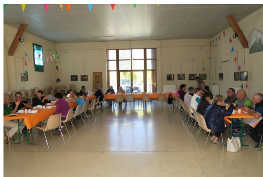
(Repas de clôture)