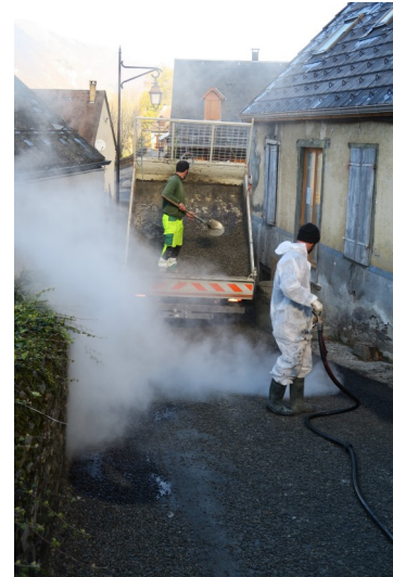
(Rue des Cascades)