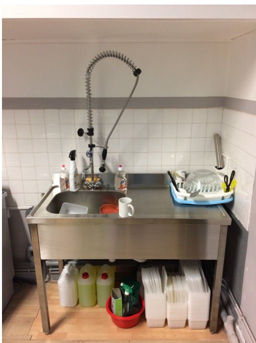
Le nouveau bac avec douchette