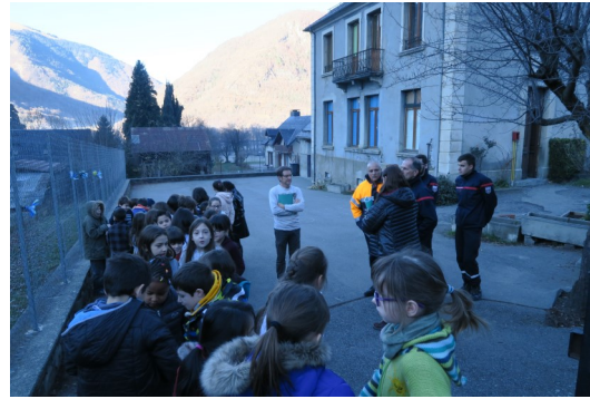
(Point en fin d'exercice)