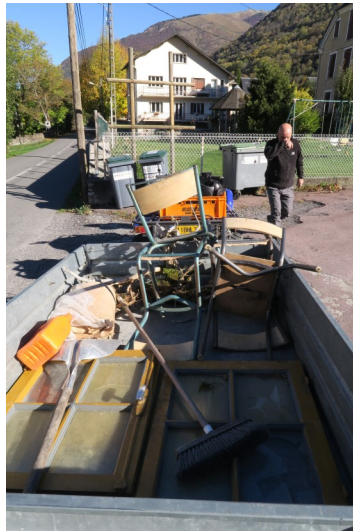
(Nettoyage des cabanes à Herran)