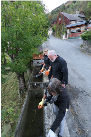
(Nettoyage des bassins)

Pour 2017, la journée citoyenne sera organisée en mai ou juin. La date n'est pas encore arrêtée.