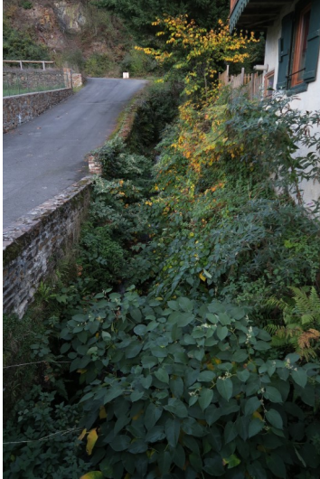
◀ ◀ ◀ ◀ Le Ste Christine partie haute ( AVANT )