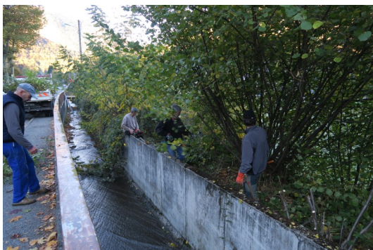
(Nettoyage du Ste-Christine, partie basse)