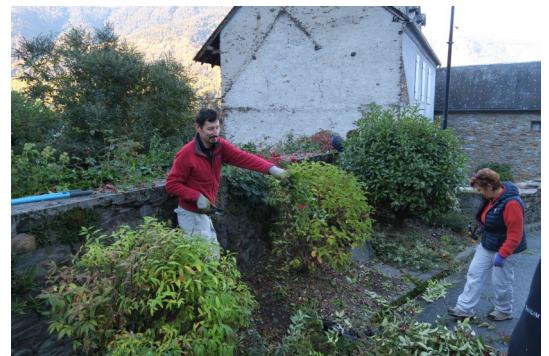
(Entretien des massifs)