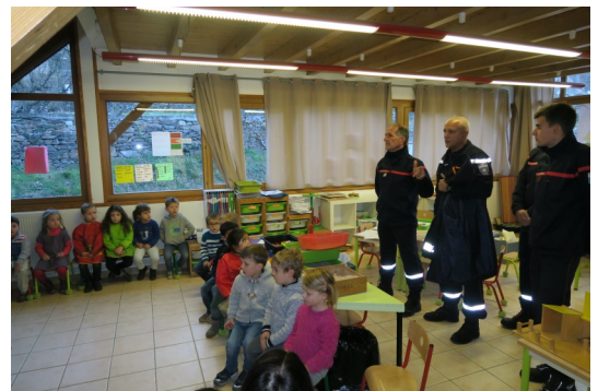
(Les enfants attentifs aux explications des pompiers)