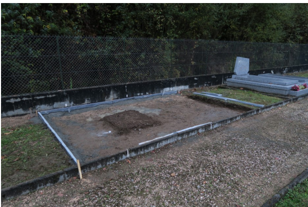
(Le début des travaux)

Il comprend 12 cases pouvant contenir chacune 4 urnes et un jardin du souvenir. La concession des cases (15, 30 50 ans ou perpétuelle) se fait sur le même principe que les tombes. Le prix des concessions sera fixé dès le prochain conseil municipal.