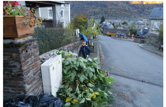
(Même les plus jeunes participent)