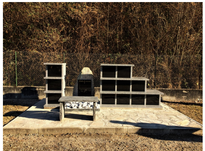
(Le columbarium terminé)