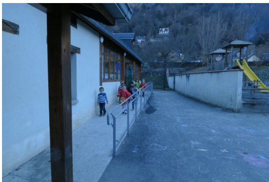
(A la maternelle aussi « sauve qui peut »)