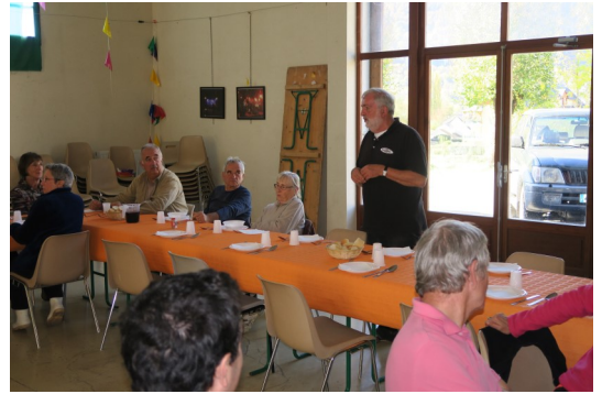
(M. le maire remercie les participants)