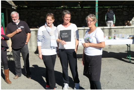
(L'équipe de l'intendance)