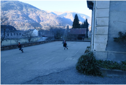
(Sauve qui peut pour les élèves du primaire).

L'exercice s'est déroulé en présence des sapeurs pompiers de Luchon, venus superviser l'exercice afin de pouvoir améliorer les comportements de chacun devant ce type d'évènement.